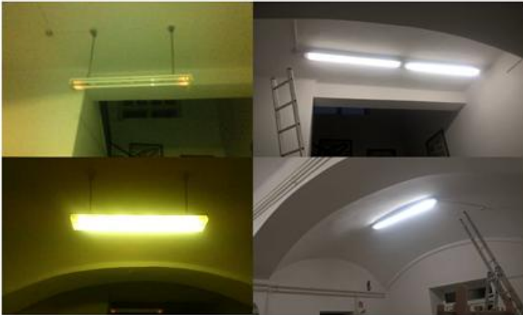
Fotó: iskola aulájáról előtte és utána

Örömmel tudatjuk a hírt, hogy elkezdődött az iskolában az elavult lámpatestek cseréje. A tamási Philips Lighting Hungary Kft. adományozott a nagyszékelyi iskola számára modern ledes és a legmodernebb technológiával gyártott fénycsöves lámpákat a világítástechnika korszerűsítése érdekében. Így lehetőségünk nyílt kicserélni az elavult lámpatesteket az iskola aulájában, tornatermében, tanáriójában, folyosóján, a könyvtárban, és nem utolsósorban a vécékben is. Az iskola bejárati ajtaja fölé egy modern kültéri ledes lámpa kerül majd felszerelésre. Köszönjük szépen a felajánlást!