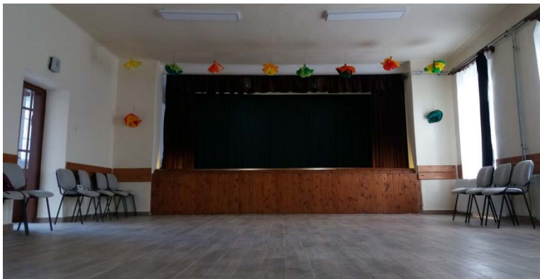
A bálterem kiállta a próbát, decemberben már adventi programok is lesznek az épületben.

Köszönjük az észrevételeket! Kérem, hogy az ilyen hiányosságot senki ne vegye többnek annál, ami: emberi tévedés! Az írásokkal kapcsolatos észrevételekkel bárki megkereshet engem ( Arany Beáta, 30/516 5933 ), vagy elhelyezheti üzenetét a polgármesteri hivatalban található „Hírmondó” feliratú dobozba.